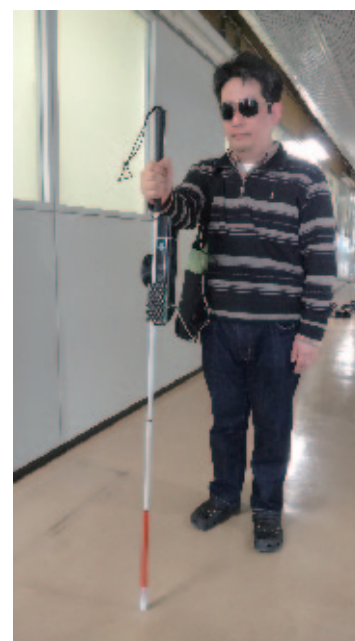
Fig. 2 Assistive system for the visually impaired.