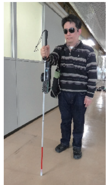
Fig. 2 Assistive system for the visually impaired.